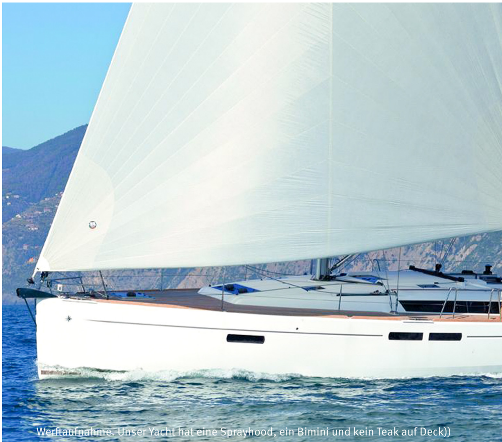
Werftaufnahme. Unser Yacht hat eine Sprayhood, ein Bimini und kein Teak auf Deck))